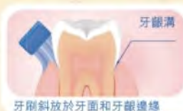
牙刷斜放於牙面和牙齦邊緣

有見及此，衛生署2008-09年度「全港愛牙運動」繼續以『全城愛牙牽一線』為主題，向市民傳遞正確潔齒方法，本月開始推出各項宣傳活動，敬請密切留意：